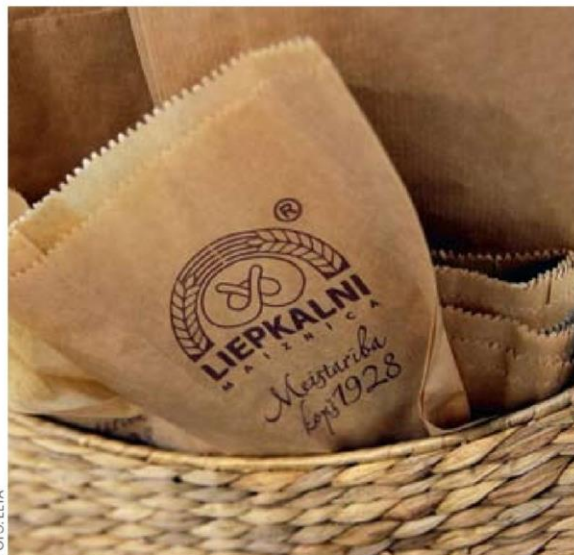
SIA Liepkalni par intelektuālā īpašuma jautājumiem domā nopietni